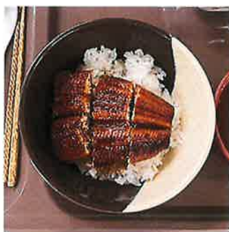
👉 8/24,25 鰻丼