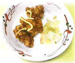
北海道郷土料理 ザンタレ