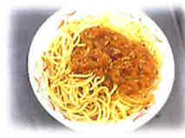
↑5/19 ミートソーススパゲティ

七夕にそうめんの由来とは？ 織姫が機織りの名手で、そうめんを機織りの白い糸を見立てている説など様々あります。