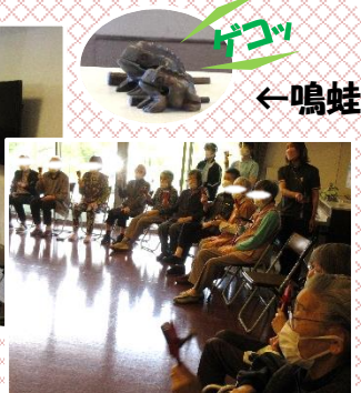
鳴子でリズムとり♪

約 2 年ぶりの開催となりました。皆さんクイズにも歌にもとても積極的でした。1 音発音しなかったり、輪唱をしたりと苦戦！楽しい時間を過ごしました☆