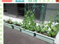
きゅうりは収穫が始まりました♪

今年は多容荘でもさつま芋を作ります、ドリーム陶都の農福の方々が来て下さり、土を整え、苗植えも一緒にしてくださいました。10 月の収穫が楽しみです！