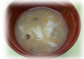
↑ 5/31 だんご汁風