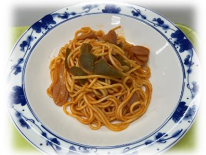
↑ 6/10 ナポリタン