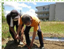
紅はるかの苗です★