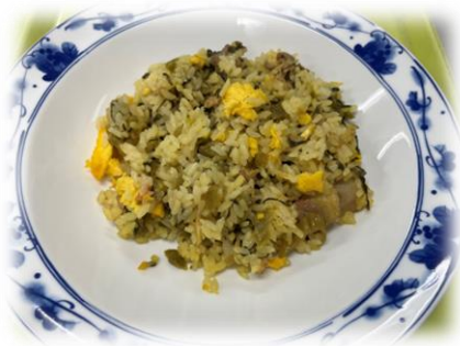
↑ 5/16 高菜炒飯