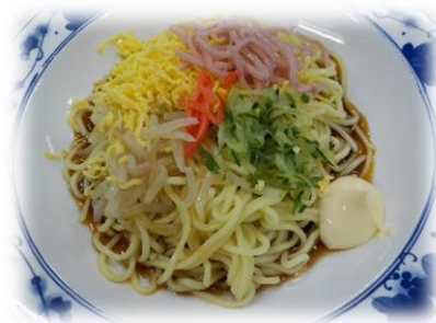
↓ 6/3 冷やし中華