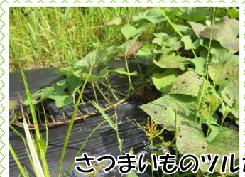
さつま芋のツルが 伸びてきました