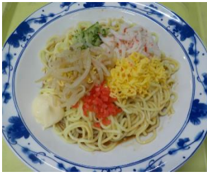
↑ 7/15 冷やし中華 味噌だれ

中秋の名月は“1年で最も美しい月”で、旧暦8月15日に見える月のことを言います。今年9月10日です。