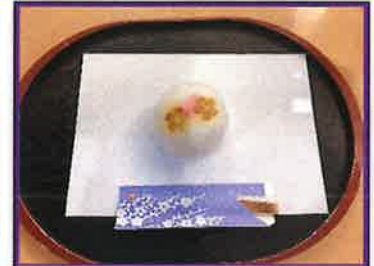
実茶レクのお茶請け