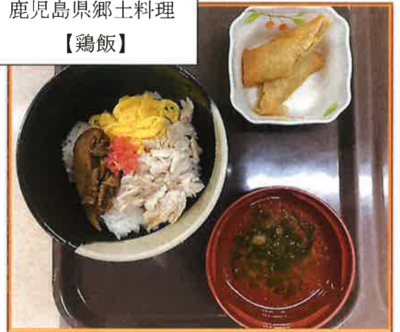
鹿児島県郷土料理 【鶏飯】

鶏肉のほぐし身や具をのせたご飯の上からねぎと生姜が効いた御出汁をかけて頂きました♪