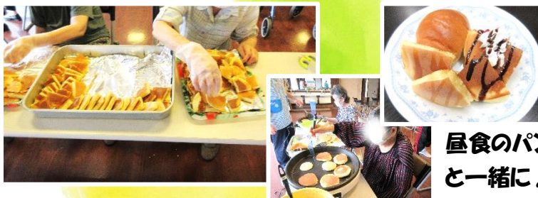
昼食のパンと一緒に♪

今回は午前中に作ってお昼に提供しました。本日の献立はパン食。いつもより少し豪華な昼食になりました！