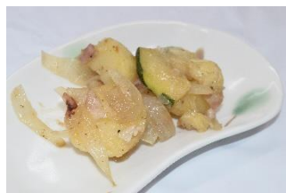
小芽とズッキーニのパーコンソテー