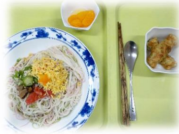
↑ 7/7 セタそうめん